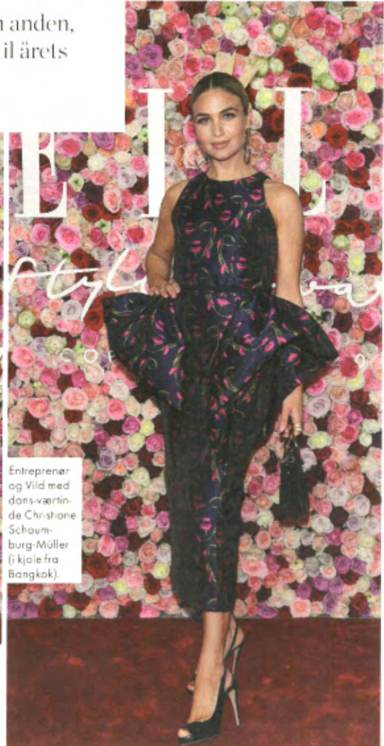
Entrepreneur og Vild med dans-værtinde Christiane Schauburg-Müller (i kjole fra Bangkok).