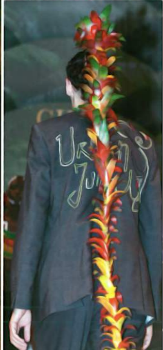
▶ Hovedbeklædningens opsætning og dens lange forløb ned ad ryggen er skabt af Guzmania i et fantastisk billede af noget reptil-/øgleagtigt.