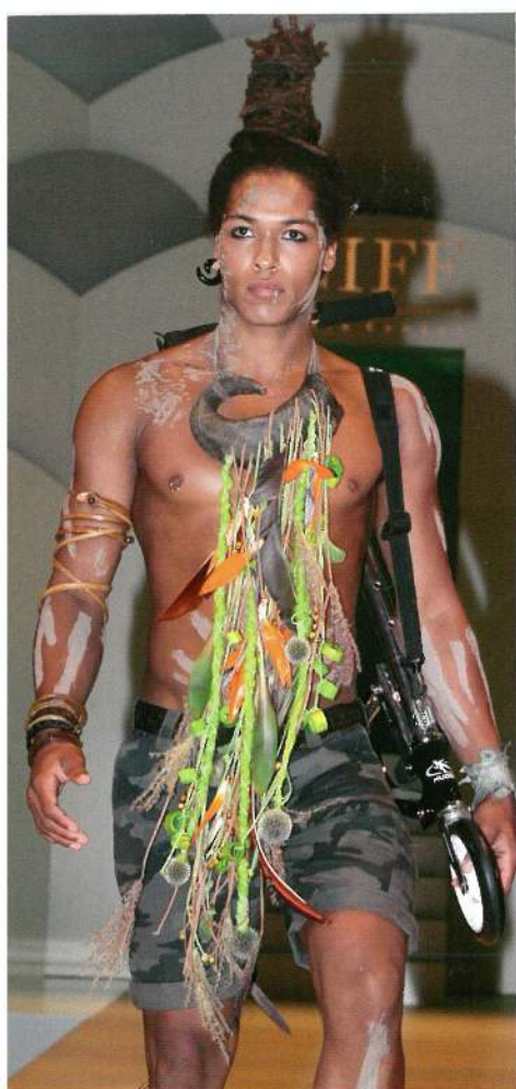
En storbykriger. Fra hornet om halsen hænger lædersnore pyntet med fjer, frøstande og Strelizia.