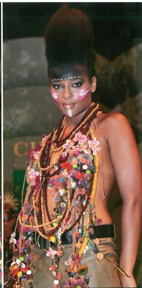
Brystsmykke til en skønhed fra den urbane jungle skabt af lædersnore og pompon-smykker dekoreret med små Phalaenopsis, fjer og små bær.